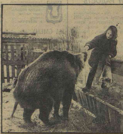
Пензенская область. Великий район.

В ШКОЛЬНЫЙ. (Наш специальный корреспондент).